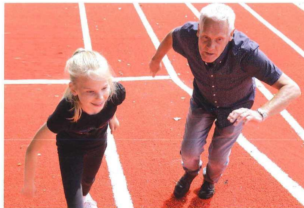
De Skills Garden is bedoeld voor jong en oud, die er ook samen kunnen sporten.

Haven. Wel is het zo dat deze wijk specifieke kenmerken heeft waardoor het extra interessant is om hier een Skills Garden te hebben."