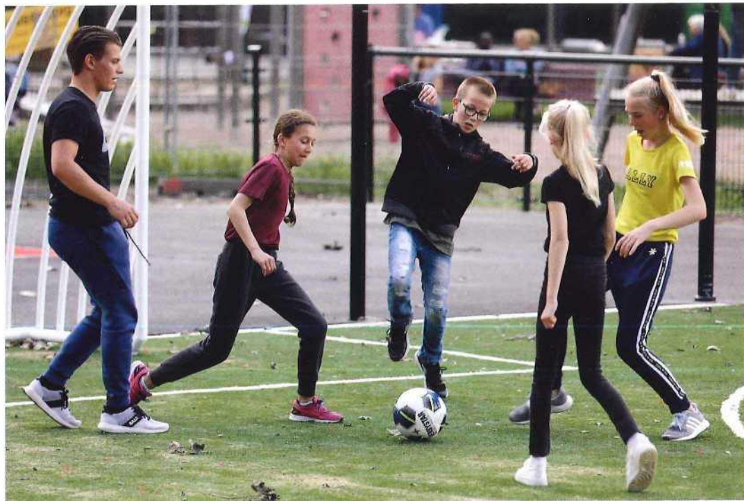
Het voetbalveldje ligt in het midden van de Skills Garden in Almere Haven.

Een kans deed zich voor toen in Almere Haven het Stadswerkpark een nieuwe inrichting kreeg. "Er was daar een sporthal en een zwembad", vertelt Postuma. "Het zwembad is in een eerder stadium verplaatst naar een andere locatie in de stad. De sporthal was op en moest helemaal verbouwd worden. Omdat in het nieuwe plan de sporthal 180 graden werd gedraaid, inclusief alle omliggende voorzieningen als een parkeerplaats en een kleine playground, ontstond nieuwe ruimte. In plaats van een zelfde kleine playground te realiseren, grepen